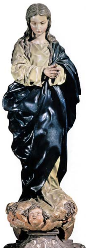
Inmaculada (Alonso Cano)

Alonso Cano (1601-1667). Representa a la escuela andaluza, pero de Granada. Con gran influencia italiana su obra se caracteriza por la elegancia, tiende al manierismo italiano, alejándose del dramatismo castellano e interiorizando el dolor y un mayor clasicismo formal. Su obra cumbre es La Inmaculada (1655), aunque destacan otras obras como La Virgen de la Oliva.